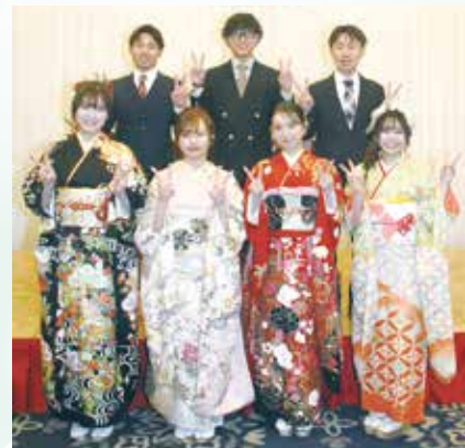
実行委員のみなさん