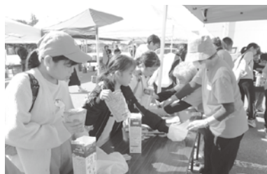
非常食セット作り