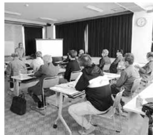
覚田防災士の講話