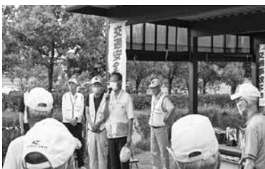
高齢者パークゴルフ大会