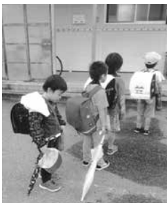
キチンと並んで「ただいまー!」

子ども会は今後も保護者の方々と連携を取りながら、元気一杯の子ども達を安全に支援、見守り、援助していきたいと思っておりますので、地域の皆様のご協力をよろしくお願いいたします。