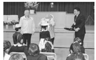
〈蜷川小学校入学式〉 黄色い帽子進呈式

5月には蜷川地域支部「高齢者パークゴルフ大会」を開催し、競技後に「交通安全教室」を開催し交通安全啓発活動を実施しました。