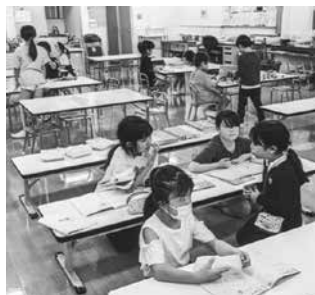
宿題をしてから遊びます