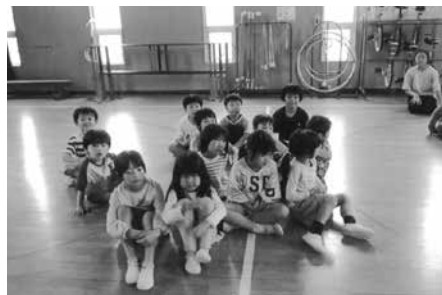
訓練! 訓練! 不審者です!