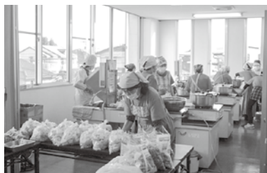
炊き出しカレー作り

災害に強い蜷川をめざして、これからもより良い活動をしていきたいと思えます。一緒に活動していただける方、お声をかけてください。いつでもお待ちしております。