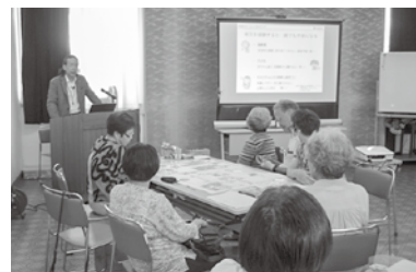
赤十字講習会受講