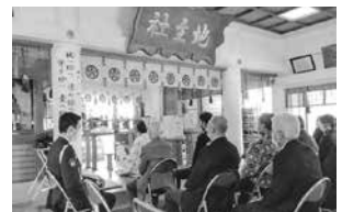
〈上袋神明社〉 蜷川地域支部交通安全祈願祭