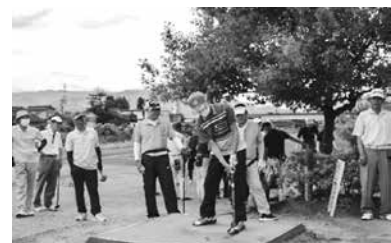
はつらつプレー中

蜷川地域支部役員全員一同、交通事故が1件でも減少するよう活動を推し進めています。今後とも地域の皆様のご協力、ご支援の程宜しくお祈い致します。