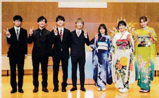
実行委員のみなさん