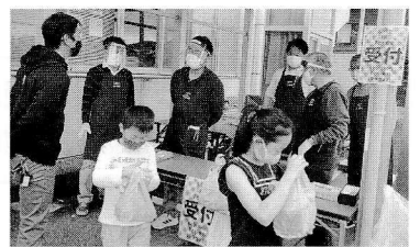
状況によっては屋外でのお弁当引き渡し