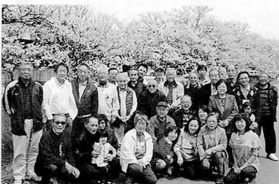
密が懐かしい花見の集合写真

コロナ禍の一日も早い収束を願いつつ、これからも、住民皆さまのご協力の下、「きれいで住みやすいまちづくり」を進めていく所存です。