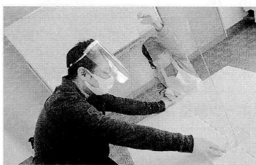
会食の際にはアクリル板の設置