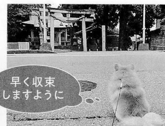
赤田地主社にコロナ収束祈願