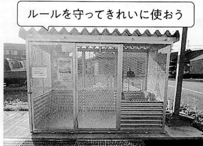
新設したごみ集積場