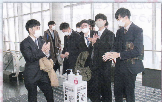
検温・手指消毒・マスクをしての開催