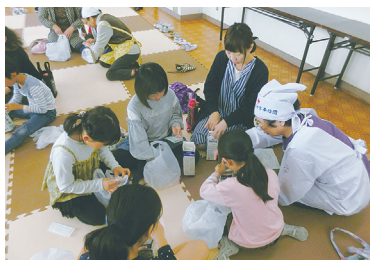
親子の非常食セット作り