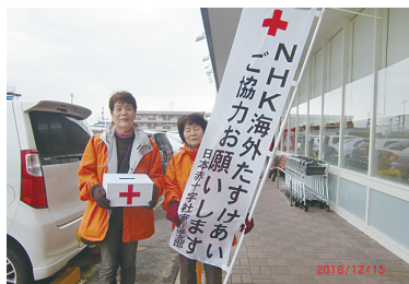
NHK海外たすけあい運動

一人でも多くの方々が防災に関心を持っていただけるように頑張っていきたいと思っております。