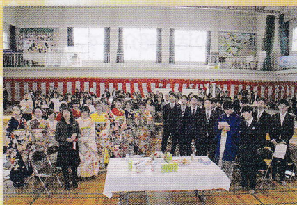
懐かしの校歌斉唱