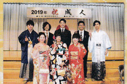
第2部実行委員のみなさん

会場設営や当日のお世話をしてくださった、町内会長、各種団体等関係者の皆様、ご協力ありがとうございました