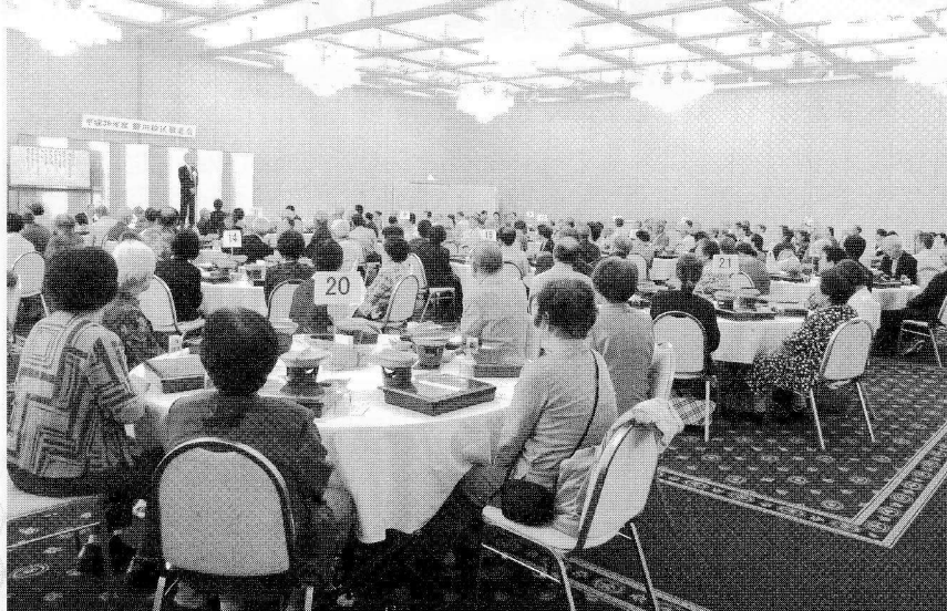
たくさんの方々にご参加いただきました

ビンゴ大会、カラオケ大会は今年も大変盛り上がり、「おわら踊り」も行われました。会場のあちこちで会話ははずみ、笑顔もあふれ、楽しい時間があっという間に過ぎました。町内会長はじめお世話いただきました皆様には、たくさんのご協力ありがとうございました。