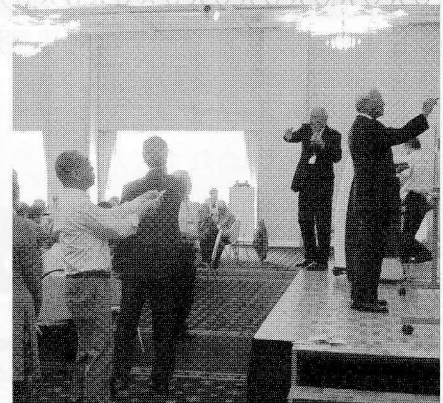
今年もビンゴ大会は大盛況

平成30年度蜷川校区敬老会が、9月12日（水）立山国際ホテルにて開催されました。一昨年173名、昨年186名と参加者が増え、今年度は203名と200名の大台を突破しました。井波自治振興会会長が冒頭に「蜷川の歴史に貢献してこられました皆様が今年も沢山お集まりになり、大変喜ばしく思います。ますますのご健勝で活躍されますことを祈念します。」と挨拶をしました。