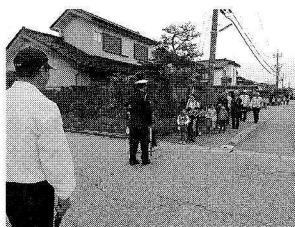
蛭川小学校新1年生の交通安全教室

毎年住民の皆様をお願いしている「車両割賛助金」は蛭川地域の交通安全活動に優先的に使用させていただいております。