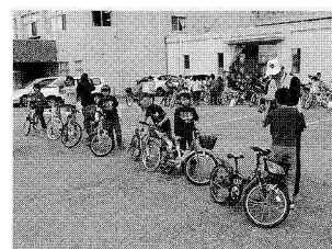
蛭川小学校4年生の自転車教室