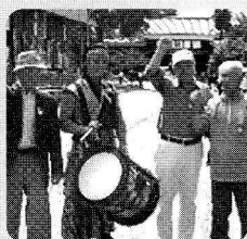
【多彩な事業】 研修旅行 女性手作り教室 水飲み運動