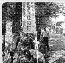
【社会奉仕】 太田川沿い除草 友愛訪問 施設ヘタオル贈呈