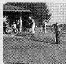
【健康づくり】 パークゴルフ カローリング 歩こう会