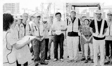
カギ掛けキャンペーン