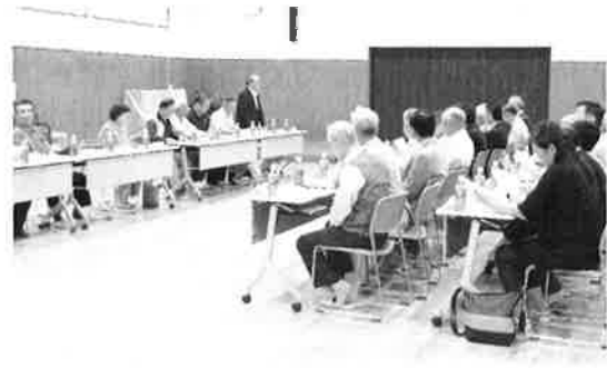
熊野地区センター