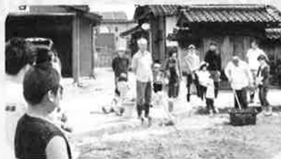
井波振興会長の挨拶