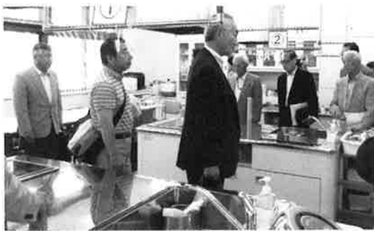
太田地区センター

熊野自治振興会からは、ふるさとづくり推進事業が幅広い年代層からの意見を汲み入れることにより地域が大いに活性化されたことを伺いました。また、女性からの意見を積極的に取り入れられ改築された太田地区センター(公民館)の建物は、将来の蜷川地区センター改築に向けて大変参考になりました。