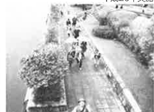
環水公園から岩瀬まで運河ウォーキング