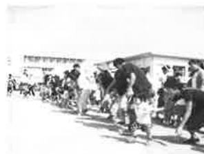
運動会未就学児かけっこ