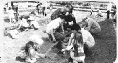
さつまいも 苗植え作業の様子

今年も赤田地区の地主の方のご協力を得て、「さつまいもの苗植え体験」を行いました。今年は20組限定で募集をしたところ、あっというまに定数になりました。区割りをした畑を参加者で1区画担当してもらい、自治振興会やおやじ倶楽部のみなさんのご指導を得ながら苗植えを行いました。天候にも恵まれ、暖かい日差しのもと土に触れ、自然とふれあい気持ちの良い1日を過ごしました。10月には、苗植えをした参加者でさつまいもの収穫を行います。