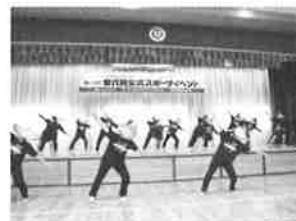
世代間交流スポーツイベント